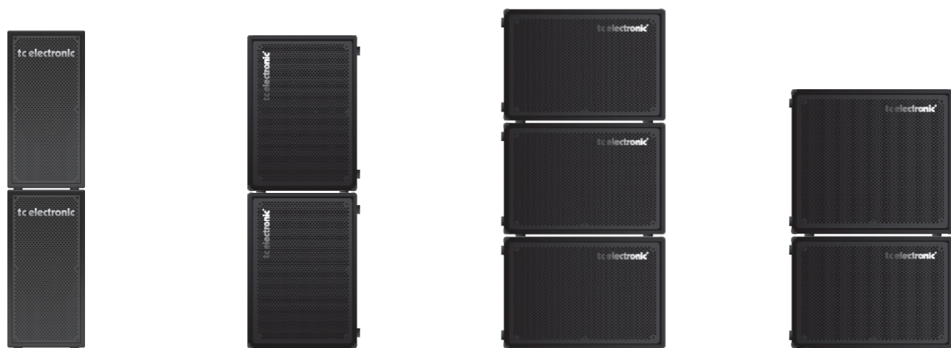
2x208 speakers stacked

⚠ For the safety of your fellow musicians and your own, please address the stability of stacked cabinets and take proper precautions to prevent the stack from being unstable or tipping over. Also notice that only two cabinets should be stacked vertically.